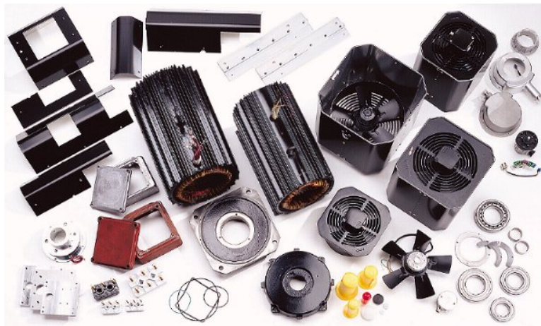
Despieze de un 2AD para reparacion