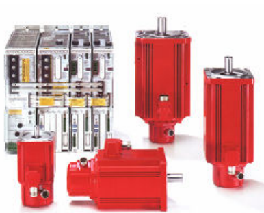
Drives y servomotores

Proveemos cables, ventiladores, freno, ventiladores, fan, frenos, reparaciones, repair, repairs.