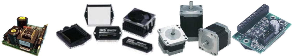
Fuente de alimentacion

Stepping motor drives, Mdrive 34, 14,17,23, Fuentes de alimentacion, Microstepping drives, systems, PCB mounted drive, half/full step drives, panel mounted drive.