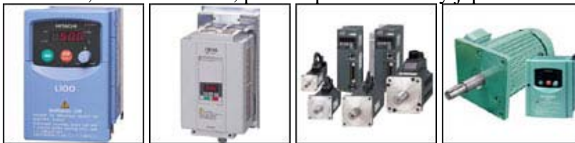
SJ100, L100, SJ200, SJ300, L300P, L300, DC MOTOR, EH-150, MICRO-EH, ADSC-SCD, AC SERVO, AD, , SERVEX.

Inverter drive, drive, servomotor, PLC, hoist, DC motor, gearmotor, motorreductores, japan servo, brushless dc motor, stepping motor and drive, motores eléctricos, variador de frecuencia, motor electrico, parts & partes hitachi y japan servo.