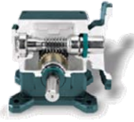
Red. De una sola reduccion