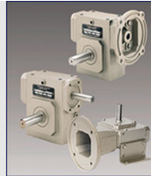
Reductores de acero inoxidable

Aplicaciones en la industria alimenticia, equipo médico, robótica. Helical worm, helical bevel, helical inline, worm gear reducer. Reductor una sola reduccion, doble reduccion, triple reduccion, doble reduccion helicoidal, Motorreductores de corriente alterna, Accesorios.